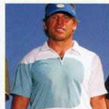
Ulf Samuelsson HOCKEYHJÄLTE

Handikapp: proffs Har du några handikapp utanför golfen? - Vänstra höften har jag haft problem med. Jag är kass på strykning också, ju mer jag stryker desto sämre blir det. Vad är det värsta som hänt dig på en golfbana? - Jag slog i vattnet tre gånger i rad på samma bana på French Open. Jag kände mig som Kevin Costner i Tin Cup.