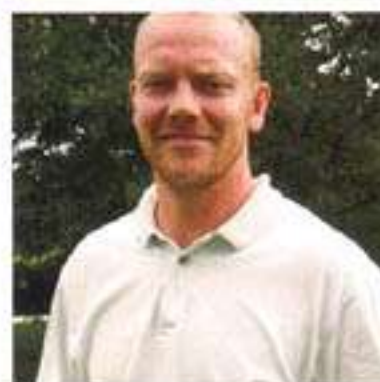
Mats Sundin NIL-JÄTTE

Handikapp: 4 Vad är det värsta du gjort på en golfbana? - Inte så färliga grejer men någon gång har jag väl slängt puttern i sjön. Vad är det bästa med golf: motionen, naturen eller råkmackorna? - Jag säger råkmackorna. Definitivt.