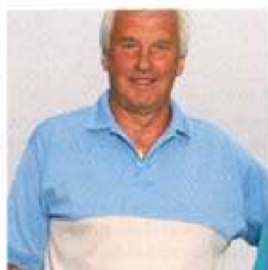
Curt Lundmark HOCKEYGURU

Handikapp: 10 Vad är det bästa med golf: motionen, naturen eller råkmackorna? - Det bästa med golf är också det sämsta, att det blir som en drog. Vem är din drömcaddie? - Arnold Schwarzenegger hade varit kul att köra med. Låta honom rengöra bollen och sånt.