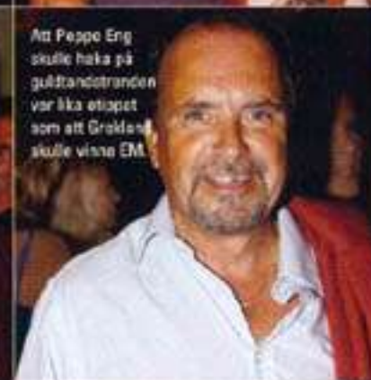
Att Peppo Eng skulle haka på guldständtranden var lika etopiet som att Gröden skulle vinna EM.