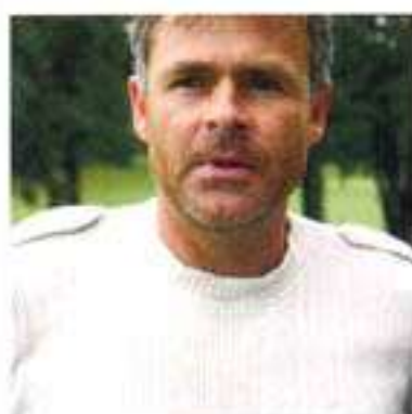
Anders Limpar FOTBOLLSHJÄLTE

Handikapp: 31 Vad är det bästa med golf: motionen, naturen eller råkmackorna? - Jag måste nog säga att det är både motionen och naturen. Vem är din drömcaddie? - Tilde de Paula, vi är väl ungefär lika dåliga på golf.