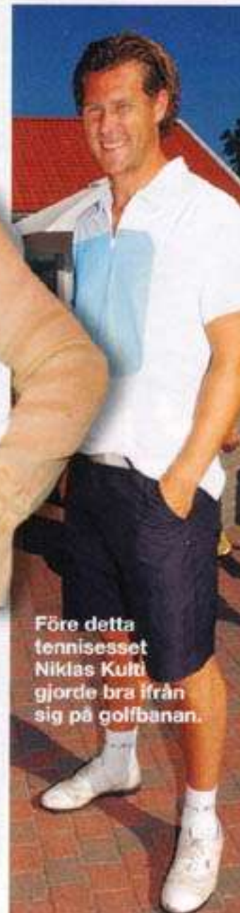
Före detta tennisset Niklas Kult gjorde bra ifrån sig på golfbanan.